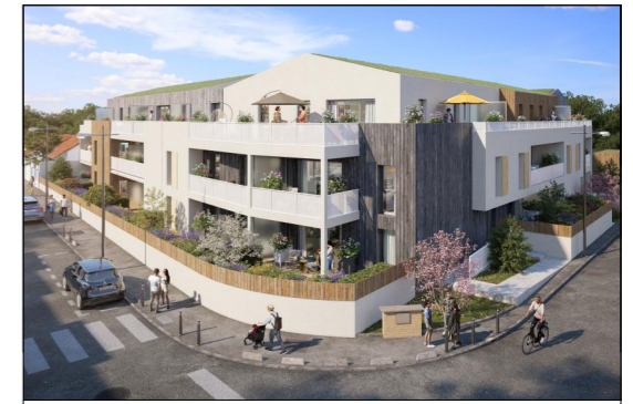
MAITRISE D'OUVRAGE SCCV STEEN ST GILLES RAIMONDEAU