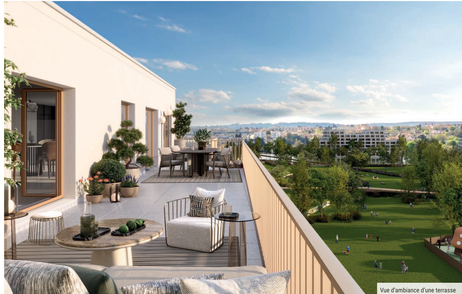
Vue d'ambiance d'une terrasse

La nature s'apprécie aussi en toute tranquillité au sein de son appartement. Les balcons et les terrasses en attique offrent un point de vue privilégié sur le parc ou sur le jardin en cœur d'îlot.